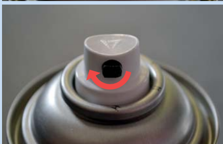
Je nach Anwendung kann die Sprühkopfdüse für horizontales oder vertikales Sprühen verdreht werden.