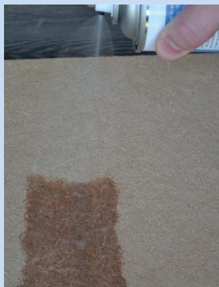
Auftragen auf einer Holzweichfaserplatte