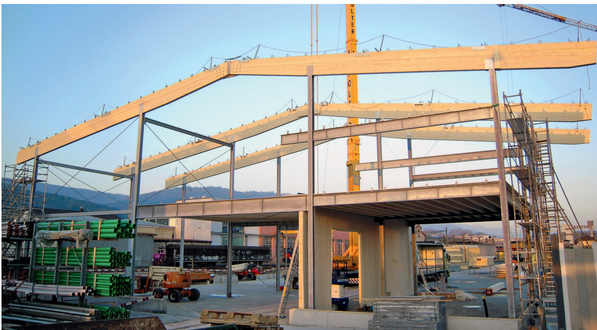
Phasen der Montage: als Einfeldträger werden die Holzbalken für die Zwischendecke in die Stahlträger eingeschoben (oben links). – Mit Zugstäben (Ø 30 mm, System Pfeifer) sind die Aussteifungskreuze ausgeführt (oben, rechts). – Das Dachtragwerk, die Geschossdecken und die nichttragenden Wandelemente wurden in Holzbauweise erstellt (links).